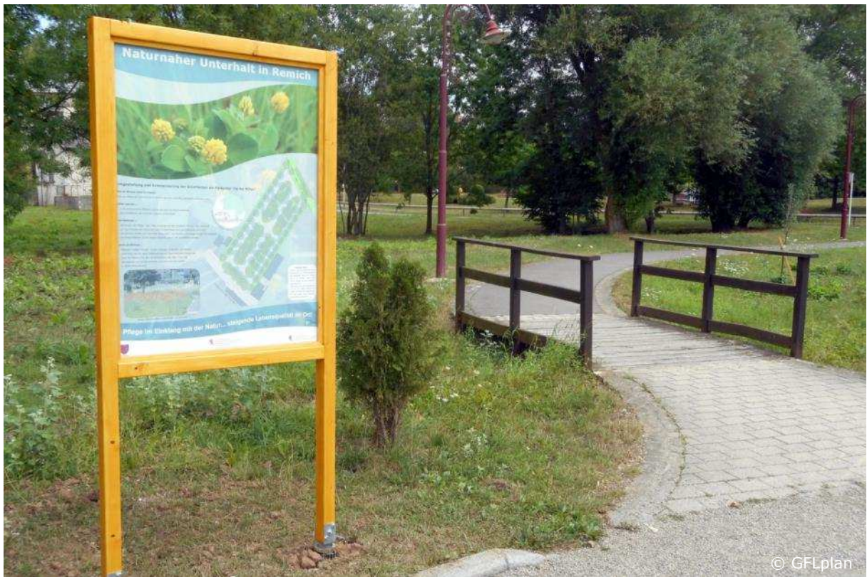
Mehrere Tafeln informieren vor Ort über die Maßnahmen