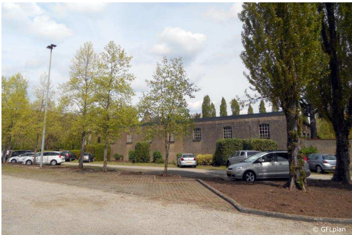
Parkplatz während der Umgestaltung: die Ziersträucher wurden entfernt, die Pflanzstreifen ausgeräumt – alles ist vorbereitet für die Ansaat einer Wiese