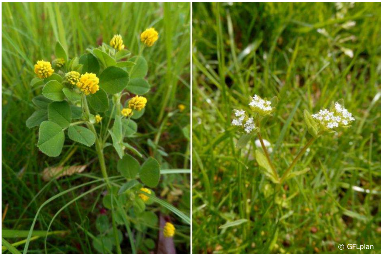
Kleine Pflanzen beginnen zu wachsen: Hopfenklee ( Medicago lupulina ) und Feldsalat ( Valerianella locusta ) haben sich bereits natürlich in den Wiesenflächen angesiedelt – zusammen mit rund 70 weiteren einheimischen Arten