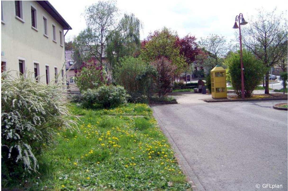
Auch der Aufenthaltsbereich mit Telefonzelle und die Parkplätze werden im Gesamtkonzept berücksichtigt