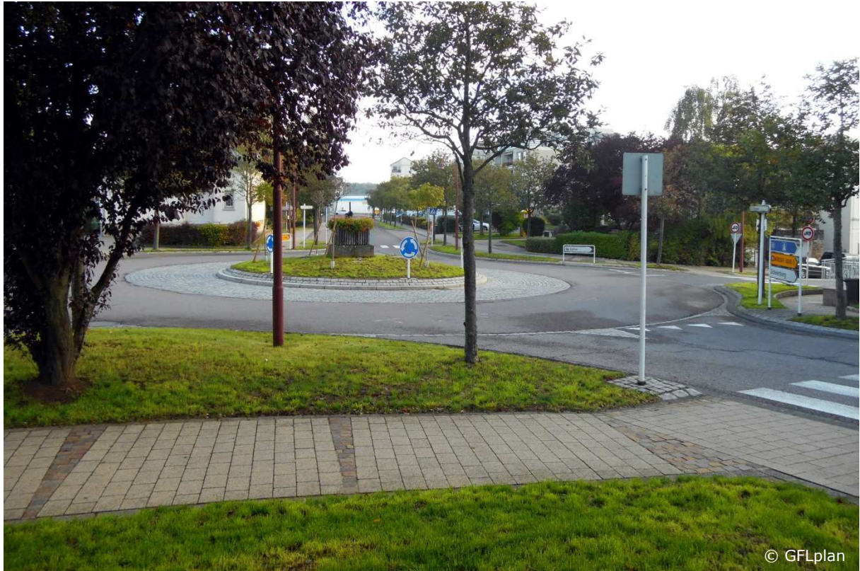
Der Kreisverkehr an der Place Nico Klopp nach dem Umbau: die Wiesenflächen sind bereits eingerichtet, aber noch nicht hoch gewachsen