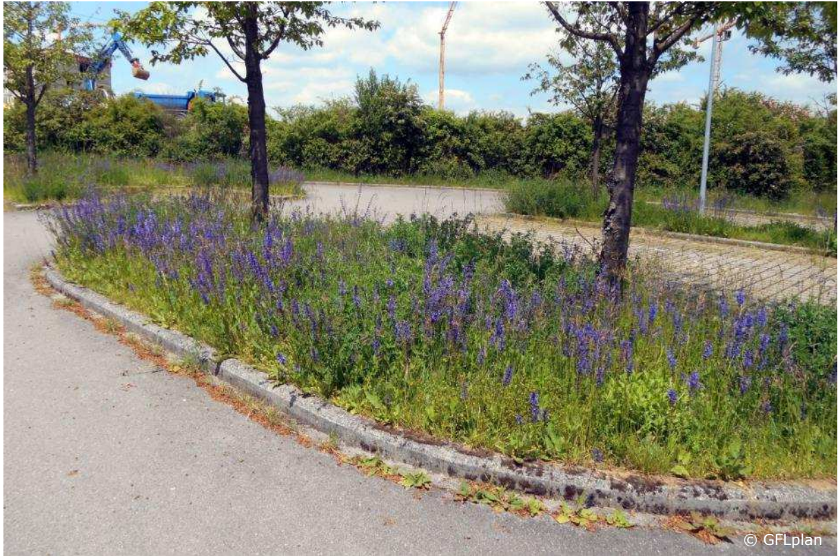
Bei guten Wuchsbedingungen entwickelt sich ein blütenreiches Bild von selbst – wie diese Salbei-Wiese auf einem Parkplatz in Mamer