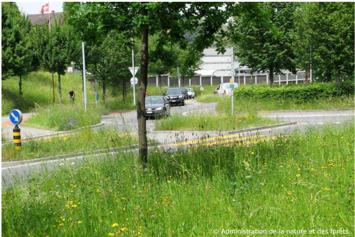
Vorbild: Ein Wiesen-Kreisverkehr in der Schweiz – durch die Einbeziehung der Nebenflächen ergibt sich ein grünes Gesamtbild, Kräuter sorgen für verschiedene Farbakzente